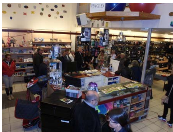
Le magasin PADD Saint Ouen L'Aumône